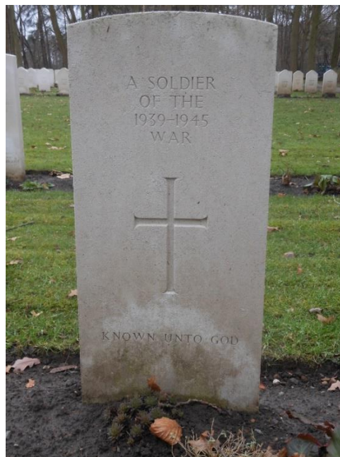
(De graven van staartschutter Wheeler en een onbekend bemanningslid op de Engelse militaire begraafplaats in Adegem. Respectievelijk plot VI-E-10 en VI-E-9.).