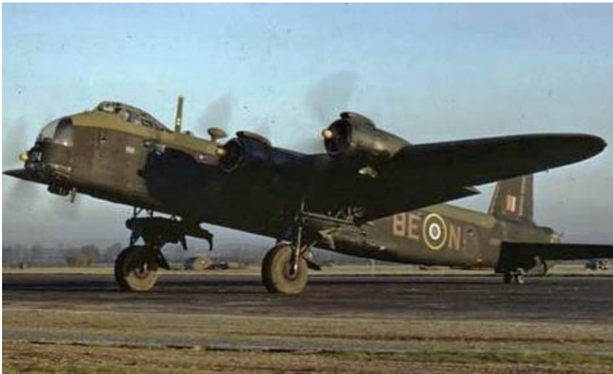
(Stirling IV LK137 met romPCODE 8E-N van 295 Squadron, Imperial War Museum)

Sgt A.S. Wheeler, begraven in Adegem (België)