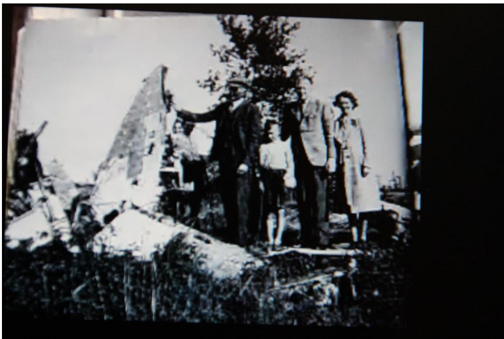
(De crashlocatie anno 1945)

In de jaren 50 is door amateur-bergers naar het wrak gegraven en zijn naar verluidt twee motoren geborgen. Stoffelijke resten zijn niet aangetroffen. v